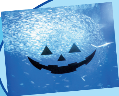
10月11日 介護者リフレッシュ事業