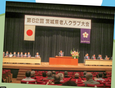
9月29日 第62回茨城県老人クラブ大会