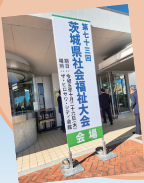
10月26日 第73回茨城県社会福祉大会