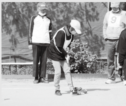
▲ゲートボール大会

これらの各種スポーツ大会は、10月に開催予定の「第28回茨城県健康福祉祭いばらきねんりんスポーツ大会」（茨城県主催）の予選会も兼ねており、町の代表選手に選ばれた皆様の県大会でのご健闘を心よりお祈り申し上げます。