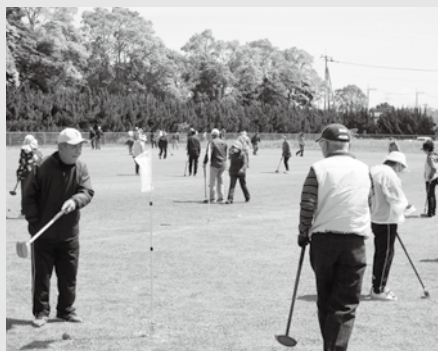
▲グラウンドゴルフ大会