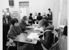
▲役割毎に分かれての訓練